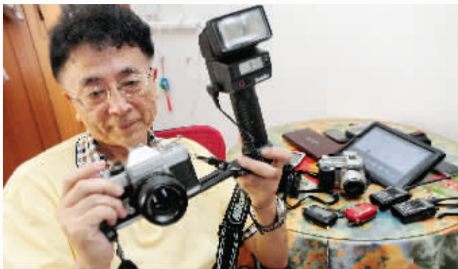
武子大爷正在把玩他的旧“家当”

“除了电脑、手机,我还喜欢收音机、照相机、摄像机。”武子大爷将记者领进他的储藏室。这里专门堆放他淘汰的电子产品。“我1988年就玩摄像机了。”武子大爷介绍,他的第一台摄像机是松下M7型。后来,他还创办了金玫瑰摄影,专为婚礼录像。