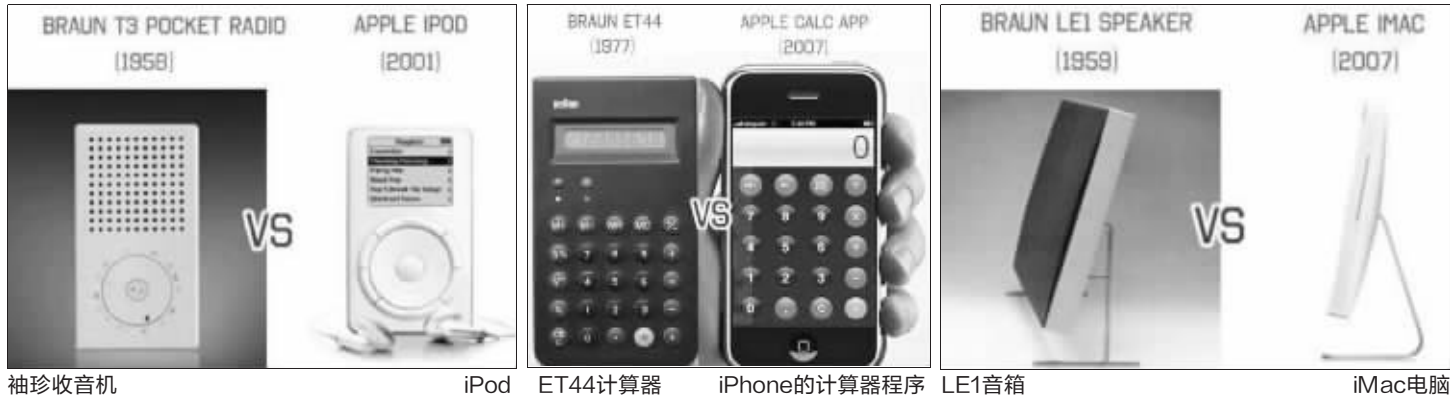
袖珍收音机 iPod ET44计算器 iPhone的计算器程序 LE1音箱 iMac电脑

你是不是认为苹果公司的产品独一无二 看看这些产品对比,左右分属两家公司 你是否感觉他们之间有千丝万缕的联系? 是的,这两家公司的设计师也是好朋友!