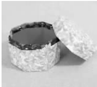
自制的收纳盒很有复古美感