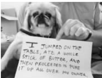
▲我跳上桌子,吃掉一整块黄油,然后跑到主人那吐了他一身 ▲我吃光了所有起司

日前,国外著名轻博客网站Tumblr上爆红的帖子之一,是被戏称为“猫猫狗狗道歉啦”的配图摆拍帖。尽管图中的主角并不会“事后改正”,饱受折磨、爱恨不得的宠物主人还是用这种方式,过了把吐槽瘾。