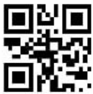
草莓派电子杂志下载

《草莓派》电子杂志周刊每周三出版,目前周刊已上线24期,除了周刊之外,《草莓派》杂志还定期推出特刊,9月为美丽的你特别制作的《秋季美丽手册》特刊已经上线,你可以下载中国移动阅读应用后搜索“草莓派”或扫描以下二维码,获得最新电子期刊内容。