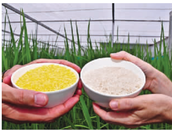
转基因黄金大米(左)与普通大米的区别(资料图片)

接下来的一系列调查更是疑云重重,论文称黄金大米和菠菜是在美国生产、处理和蒸煮,然后冷藏运至中国实验所在地,然而湖南方面调查称,实验食材均来自当地;漩涡中的中国疾控中心也于9月5日发布调查报告,称湖南衡阳实验未使用转基因大米。论文称,所有作者均审查了原稿,但论文第二、第三、第四作者表示对论文中黄金大米试验及数据均不知情。