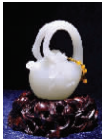
和田玉茶壶 出自贵人有玉坊

在坊间,还有一招用来区分“青海”与“和田”。和田玉有个很有趣的特征,就是它有类似人类皮肤一样的细小“汗毛孔”,是和田玉本身结构特征给人形成的外在感觉,而青海玉则没有这样明显的“汗毛孔”。据说在和田,当地人向买主推荐的第一个鉴别方法就是这个。这个比喻很形象,又直观,不相信可以用放大