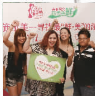
伊美达的朋友为她加油打气