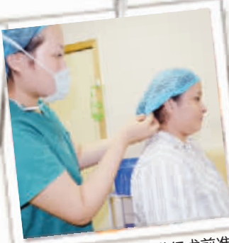
伊美达进行术前准备