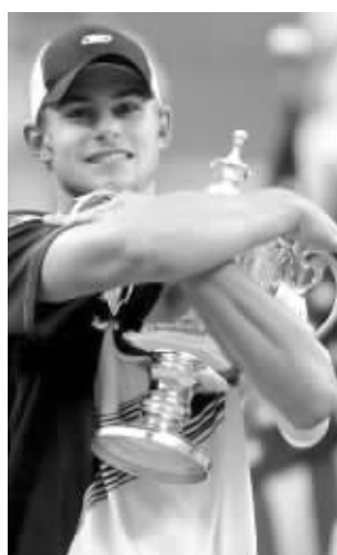
2003年美网,罗迪克赢得职业生涯唯一一座大满贯奖杯

在昨晨的比赛中,每当罗迪克打出标志性的大力发球,或在关键时刻化解危机保发成功,现场观众都会把最热烈的掌声献