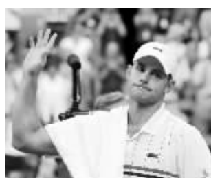
2012年美网,罗迪克止步16强,正式退役