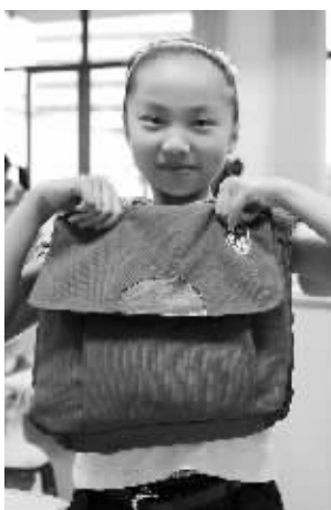
学生展示“三斤半书包”

吉祥馄饨以投资小、操作简单、全程扶持、收益丰厚为特点,提供选址、装修设计、产品供应、人员培训等支持和服务,尤其产品由公司统一生产和配送,省去加盟商自己买菜、制作的麻烦,极大地方便了加盟商。公司将逐渐在各地开店,有意者咨询:4000707517