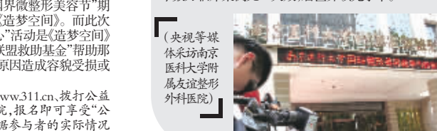
(央视等媒体采访南京医科大学附属医院整形外科)

作为全球首家执行JCI国际认证、国家最高等级三级整形外科医院，中国唯一拥有韩国专家全日亲诊的高等学府国际化整形美容教研基地，南京医科大学附属友谊整形外科医院(南京医科大学国际整形美容教学与研究中心)汇聚了“韩国改脸型第一人”金柱翰教授、“韩国眼鼻部整形第一人”朴相根博士、韩国权威眼鼻部整形专家金成镐博士、亚洲顶尖明星整形专家吴国平博士、中国面部轮廓整形领域领军专家陈小平教授、中国眼鼻部整形学术带头人林金德博士、亚洲胸部整形外科学术带头人贺小虎教授等一大批中韩顶尖整形美容力量，以颌面整形、鼻部综合整形、眼部整形、乳房整形、吸脂减肥、瘦小腿和口腔美容等学术研究而影响国际整形美容外科。同时在世界医学整形美容领域首次将颌面部整形(改脸型)、乳房整形、鼻部整形、眼部整形等融入解剖学、现代整形美容学、显微美容学，促进了当代最先进的“极速恢复整形美容技术”的诞生，真正意义上创造了“智慧的微整形美容技术”，并以独有的安全、便捷、微创等特点瞬间风靡全球，至今数万临床案例无一失败，居世界领先水平。