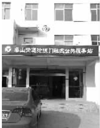
浦口的沧波门社区