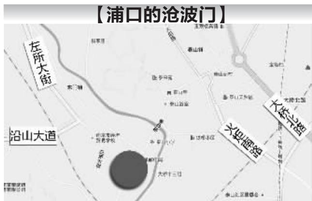
浦口沧波门的大致位置