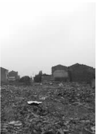
城东南沧波门现状