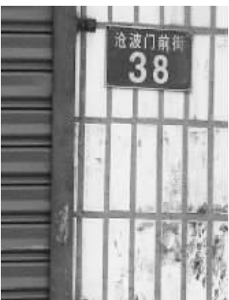
城东南沧波门前街门牌