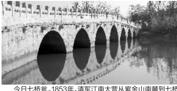
今日七桥瓮。1853年,清军江南大营从紫金山南麓到七桥瓮,连营数十座