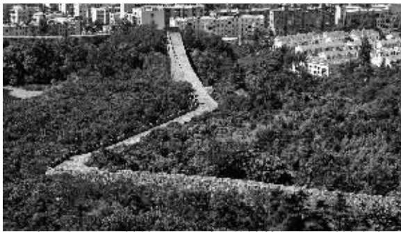
今日太平门段城墙。1853年,从神策门以顺时针方向沿着明城墙走下去,太平军都有防备