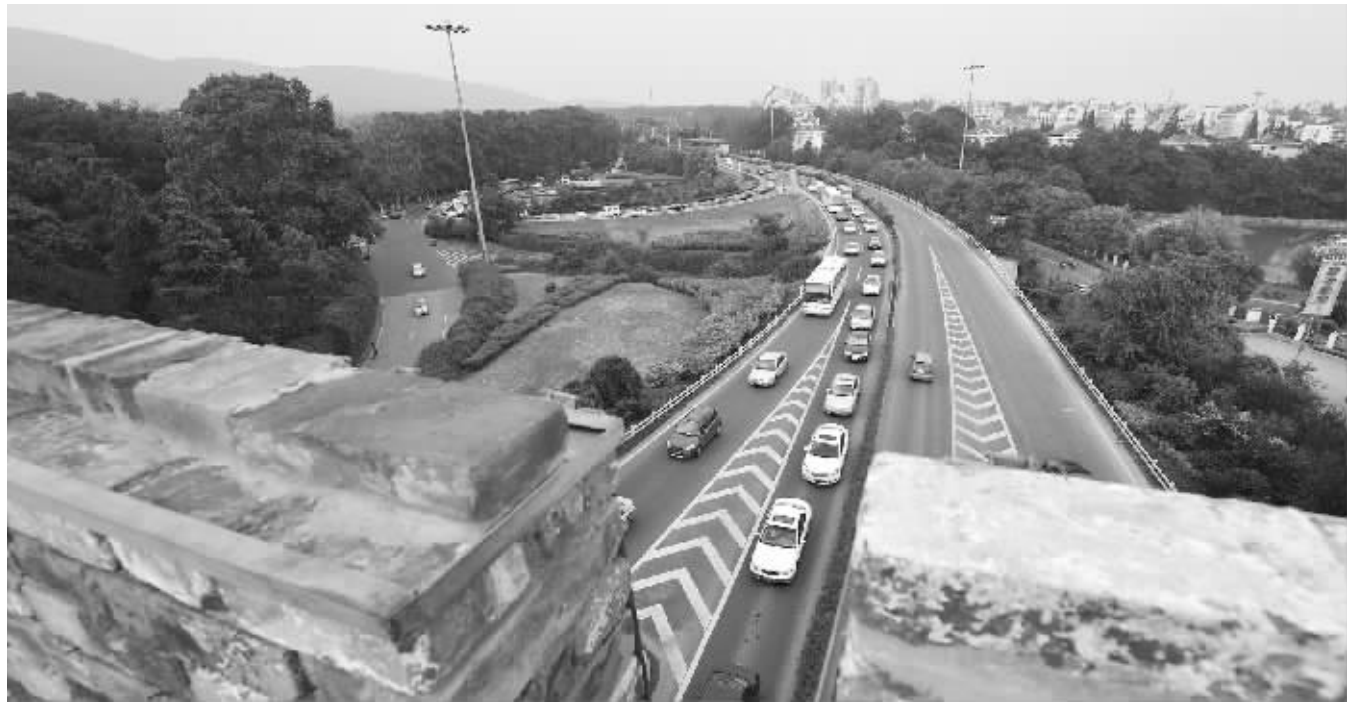
今日中山门外。1853年4月,清军将战线推进至天京朝阳门(今中山门)外孝陵卫