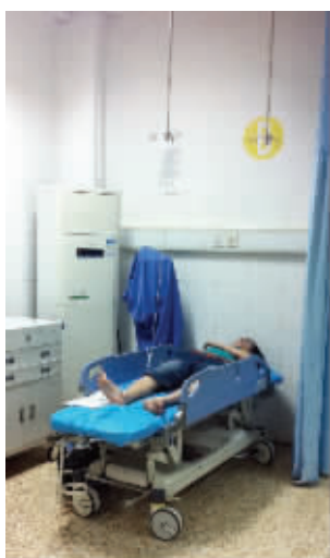
小陈的同伴躺在急诊室内

“马上开学了,我今天刚从淮安老家赶过来,行李还没来得及放下。”小周看看病床上的旅行箱和电脑包说,其他几个同伴都已毕业,只有他还在南京机电职业技术学院读大二。事发瞬间,他只模糊地意识到有车子撞过来,然后摔倒在地,接下来发生了什么就不清楚了。好在他和那个湖南小伙的伤势都不重,初步检查身上有多处软组织挫伤。