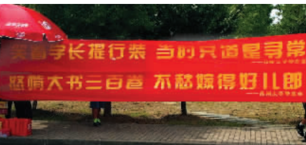
苏州大学这条迎新标语很受网友喜欢

这几天是开学的好日子,各高校也将迎新标语挂了出来,其中,苏州大学学生会的标语:“笑看学长提行装,当时只道是寻常,怒啃大书三百卷,不愁嫁得好儿郎”,被网友称为最“腹黑”却也最励志的迎新标语。