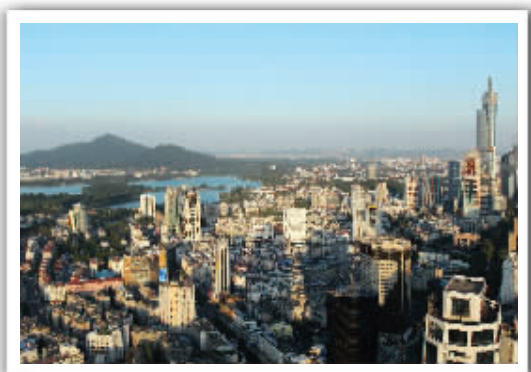
◀左前方是紫金山和玄武湖,右前方是紫峰大厦 拍摄地:山西路万豪大厦60楼