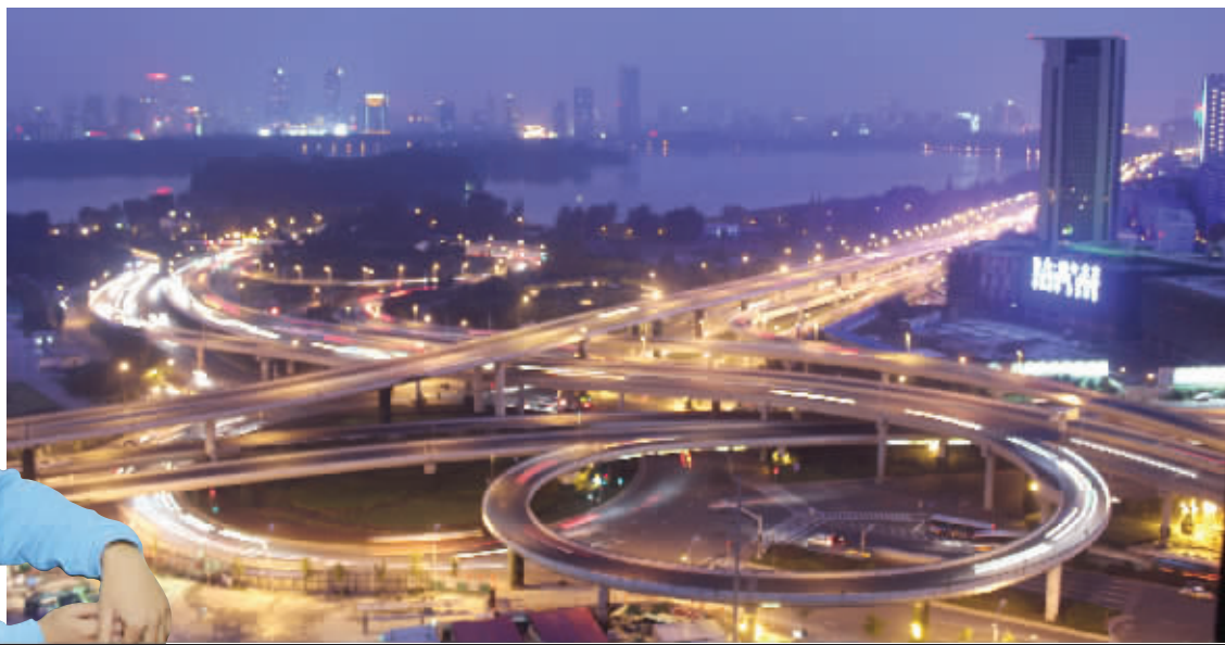
新庄立交 拍摄地:南京 林业大学研究 生宿舍楼顶