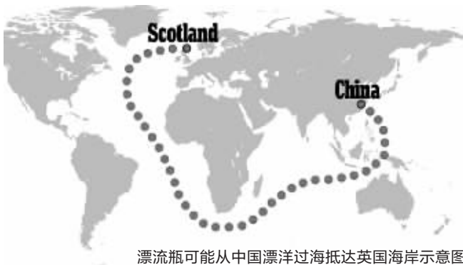
漂流瓶可能从中国漂洋过海抵达英国海岸示意图