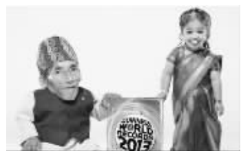
唐吉和阿玛琪为2013年吉尼斯世界纪录大全拍摄宣传照

据福克斯新闻网8月29日报道,世界上最矮的男人——72岁的尼泊尔老人钱德拉·巴哈杜尔·唐吉和世界上最矮的女人——印度18岁女孩乔蒂·阿玛琪近日在意大利首次相遇,二人为将在2013年出版的第57版“吉尼斯世界纪录大全”拍摄宣传照。据悉,阿玛琪身高24.7英寸(约合62.7厘米),而唐吉身高21.5英寸(约合54.6厘米)。综合