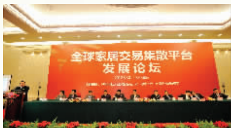
香江集团多元发展,资本雄厚

耗资1000亿元、相当于1个秦淮区,4.6个玄武湖,72个新街口商圈……近期,南京湾·锦绣香江引发南京地产界的热议讨论和南京人热切期待。而这个颇具传奇色彩的楼盘,出自中国上市