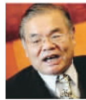
夏学奎 北京大学 社会学系 教授、博导