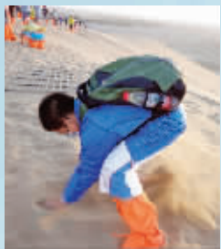
营员们玩得不亦乐乎