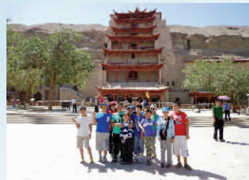
全体营员在莫高窟前合影留念