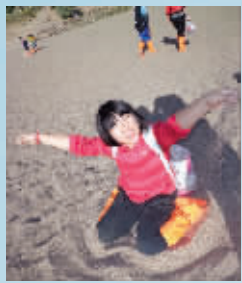
孩子们和沙漠亲密接触