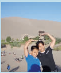
家长和孩子温馨留影