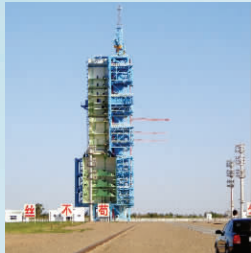
神九发射塔矗立在苍茫戈壁中

“真大呀，仰头都要看不到顶了。”同学们纷纷感叹这座莫高窟的第二大佛，该洞窟内是石胎泥塑弥勒倚坐像，据解说员介绍，该大佛头身比例虽不符合人体结构，却巧妙地解决了自下而上仰望的视觉差，观佛者能清晰地看到弥勒佛的表情。“他的眼睛微闭，好像在思考着什么，雕刻得惟妙惟肖。”面对莫高窟的艺术气质，孩子们不禁对古人的精湛技艺产生了敬佩之情。