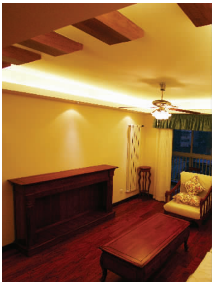
为谢师恩,家具以旧换新享补贴

现代快报“谢师惠”:旧家具换全新美庭定制无醛禾香板家具,等面积补贴350元/平方米