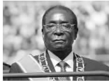
津巴布韦总统穆加贝 资料图片

据英国《每日电讯报》8月28日报道,津巴布韦工部长韦尔什曼·恩库贝日前口出惊人语,抱怨该国88岁高龄的总统罗伯特·穆加贝已经成为“国家的负担”、必须赶紧下台,因为这位老人即使在参加重要会议时也无法保持清醒。