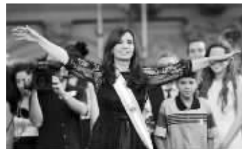
阿根廷女总统克里斯蒂娜 资料图片

据外电29日报道,阿根廷检察官表示,有证据显示该国女总统克里斯蒂娜涉嫌刑事诈骗,将寻求对其及其他涉案人员发起调查。克里斯蒂娜可能因此面临法律纠纷。