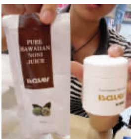
花大价钱买回的产品

根据发帖人的说法,她的母亲实实在在地被騙了不少钱。昨天下午,现代快报记者和发帖人范女士见了面,她详细讲述了自己母亲的遭遇。