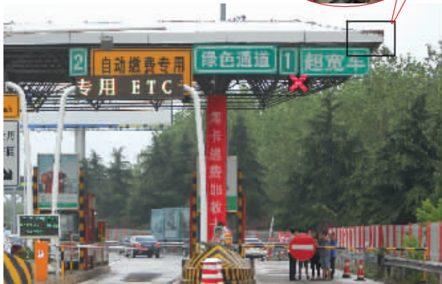
不少蜜蜂聚集在收费站的顶棚上,1号通道已被关闭

收费站内的工作人员为了驱赶这些不速之客,忙个不停。蜜蜂还将一名收费站工作人员蜇伤。为了安全起见,收费站1号通道昨天下午暂停开放。