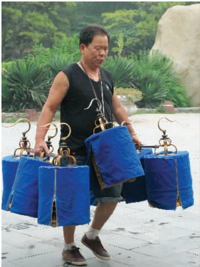
不知道为什么,看见这位大叔提着7个鸟笼,我马上就想起裁缝界的传说——《一下打死七个》(详见格林童话)。7月18日摄于公园