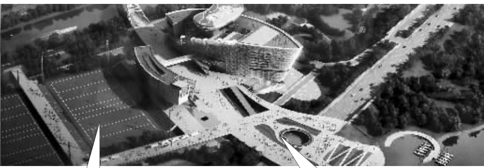
青奥赛场综合体有12个赛场,将承担青奥会橄榄球、曲棍球、小轮车、沙排比赛,2014年4月底前完成