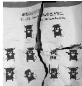
网传的“吉祥物终选方案” 微博图片