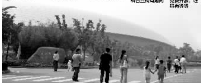
南京科技馆