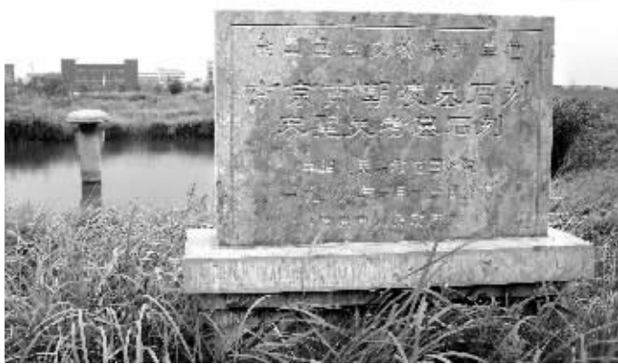
竖立在水塘里的国宝级南朝石刻