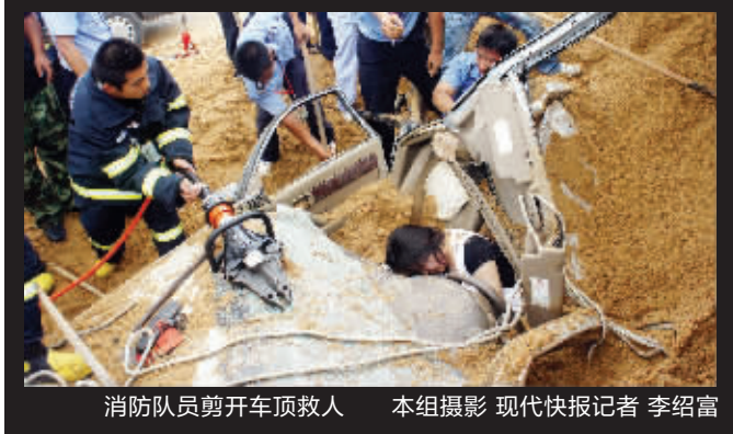
消防队员剪开车顶救人