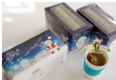
快报微博积分可兑换茶包礼盒

“快报微博会员福利来了,虚拟积分兑换有惊喜!1000积分就可兑换超萌卡哇伊茶包。每天健康一袋茶,轻松告别亚健康。快报微博各位靓妈们,还等什么,快来抢兑啊!”8月27日,快报微博(t.dsqq.cn)小编@圈圈妹妹的“福利微博”立即引起广大博友的关注。