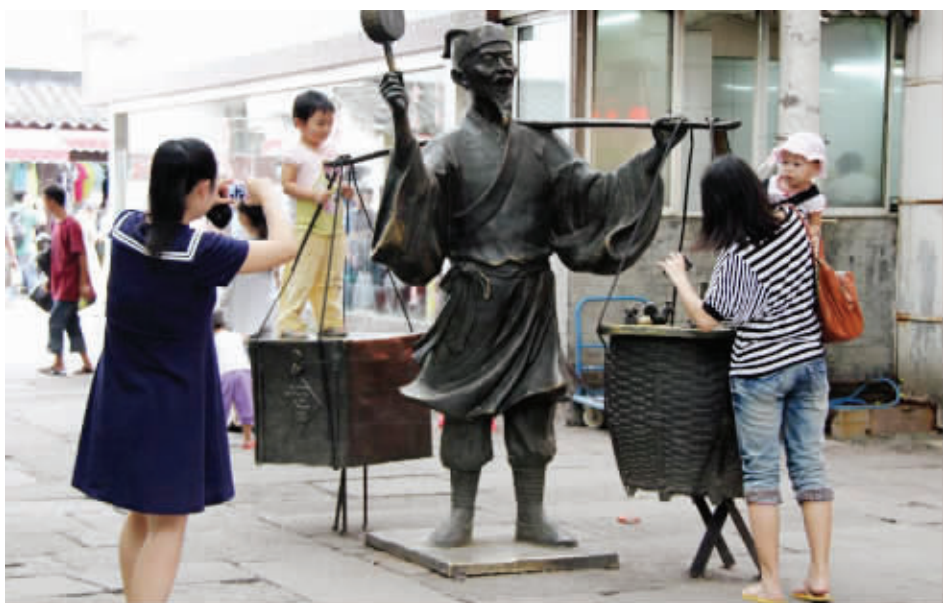
古人云:快给老夫下来,担子太重,吃不消了。8月23日摄于夫子庙 (作者徐慧知获30元话费)