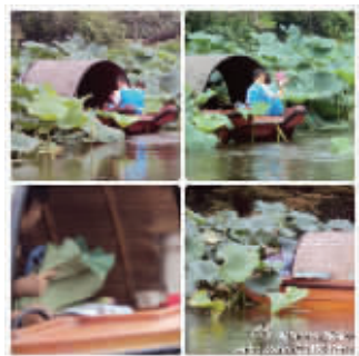
网友“Serena_媛媛头”拍到的玄武湖里游人划船摘荷花 (请网友来领取稿费)

快报讯(记者 钟寅)8月就要过去,玄武湖的荷花花期将要结束,可仍有游人在划船时把手伸向仅剩不多的荷花。公园管理部门呼吁,游人要爱惜荷花,不要采摘荷花荷叶。工作人员还介绍,依据《南京玄武湖景区保护条例》,采花者可被处以50元的罚款。