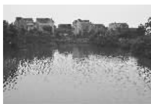
鲁墅村内河道密布 现代快报记者 姚斌 摄