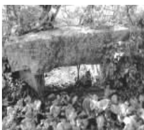
几百年未动的老虎口石坝