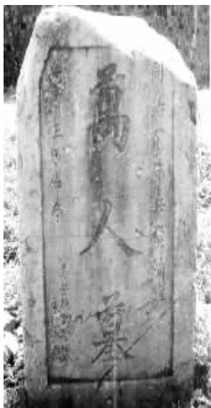
村中遗留下的清代万人墓碑

第三处是老虎口石坝,位于关帝庙的正南方,几百年来纹丝未动。村上老人代代相嘱:无论发生何种情况,老虎口石坝千万不能移动。所以至今仍保存在那里。