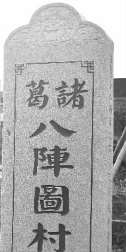
鲁墅村的布局包含图中两种阵法 制图 俞晓翔