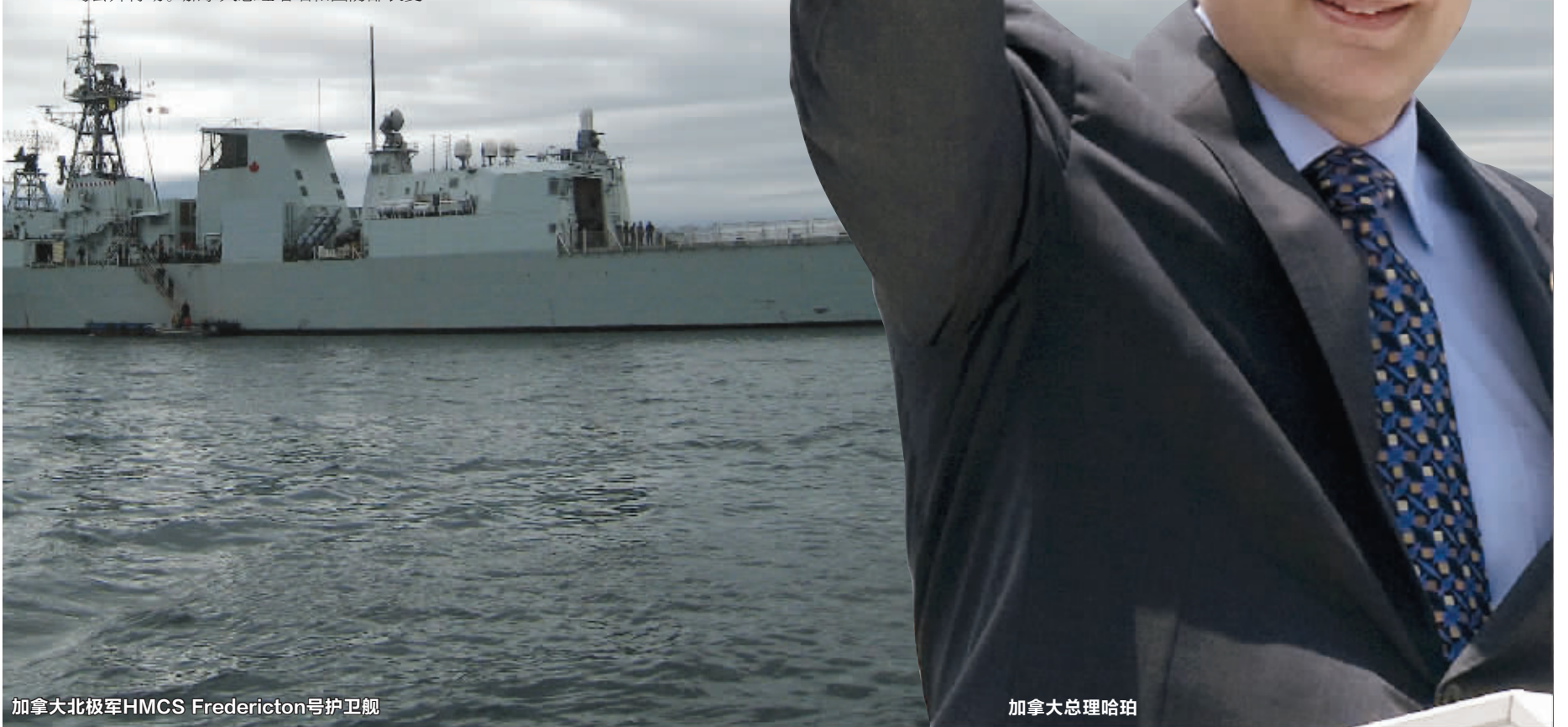
加拿大北极军HMCS Fredericton号护卫舰