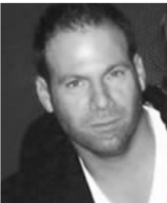
网上流传的枪手照片