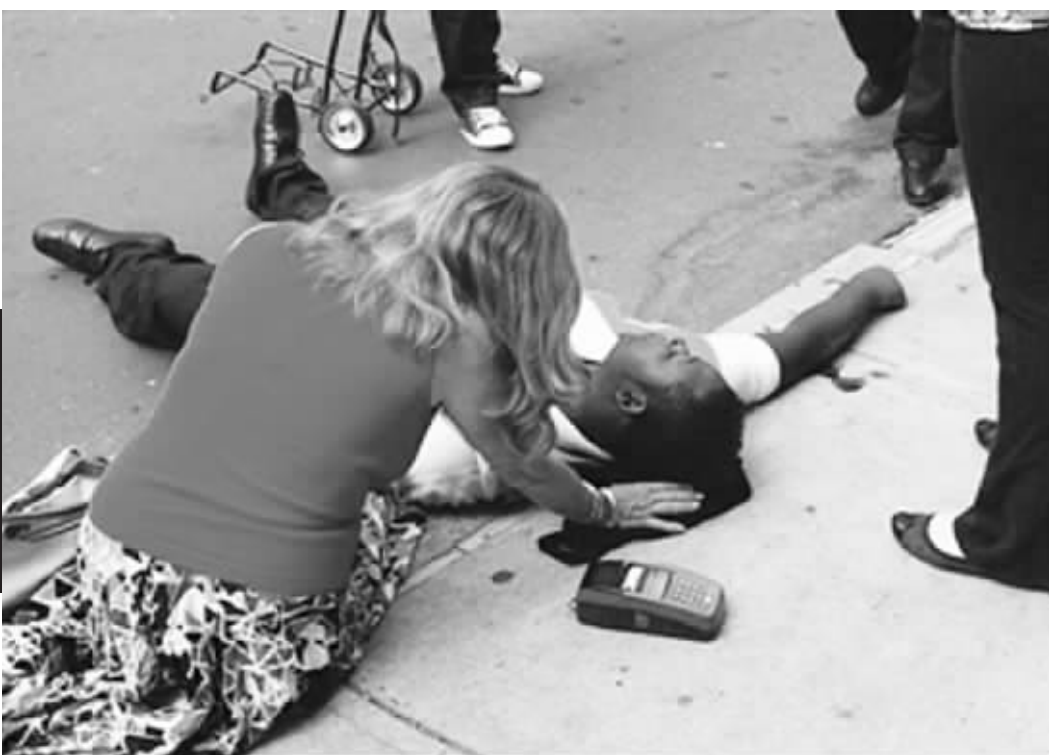
路人看护枪击事件遇难者