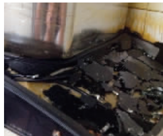
抽油烟机的面板全碎了

记者在网上搜索到无数类似的故事,在12315热线处,记者也了解到,今年以来,已经接到了数