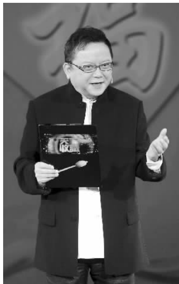
《天下收藏》主持人王刚

近日,王刚被指在鉴宝节目中砸毁多件珍品文物。有知情者称,王刚主持节目所谓的“赝品”是节目组在旧货市场买来的假货,然后找所谓“持宝人”上台表演,最后买来的假货就被理所当然地砸掉了。