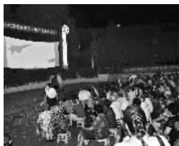
昨晚,小桃园惠民数字电影广场“开张”

快报讯(通讯员 冯智勇 记者 仲茜)昨晚,下关区“小桃园惠民数字电影广场”正式落成开张。首部露天放映的电影《盛世大阅兵》在夜幕中吸引了两千余名周边居民观看。该电影广场由下关区政府、江苏省电影公司、小桃园景区管理处、热河南路街道联合筹办,今后将定期放映免费露天电影。