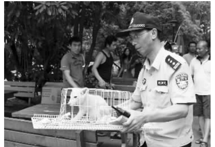
民警将小狐狸带回派出所