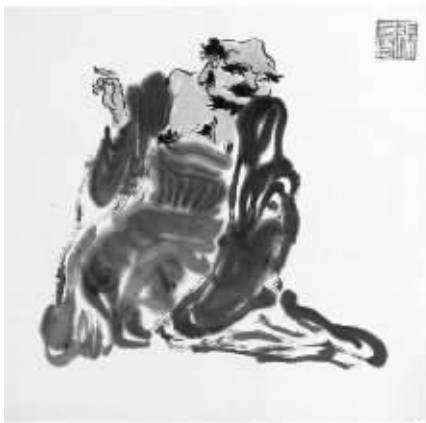
张友宪的《十六应真》(局部)