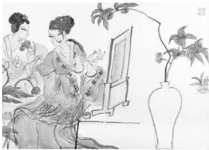
杨春华《满园春色图册》(局部)

据雅昌市场调查显示,2012年春季的艺术品市场规模几乎没有任何悬念下跌34%,金融危机以后宽松的救市流动性资金和艺术市场持续繁荣不但带来了金融投资资本的高度关注和参与,也在回调期见识了投资型资本现实功利的运作手法。而摩拳擦掌进军艺术领域的投资人也随着市场回调和各种金融化尝试的不确定性而变得格外低调。