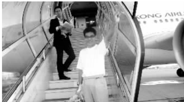
首批7人在日本冲绳县那霸机场登机,启程飞回香港

经中国政府多次严正交涉和多方努力,15日在钓鱼岛及其附近海域被日方非法抓扣的14名中国公民和所乘船只“启丰二号”已重获自由,日本方面17日无条件放还了全部14名中方人员及船只。北京时间17日19时50分许,首批7名中国公民搭乘香港航空公司航班飞抵香港国际机场,顺利返回香港。另外7名中方公民稍后将原船返回,中国海监船和香港特区海事船将前往接应。