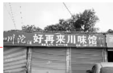
这家饭店的老板娘不幸丧生