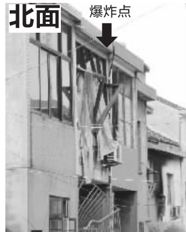
爆炸房间北面的窗户严重变形