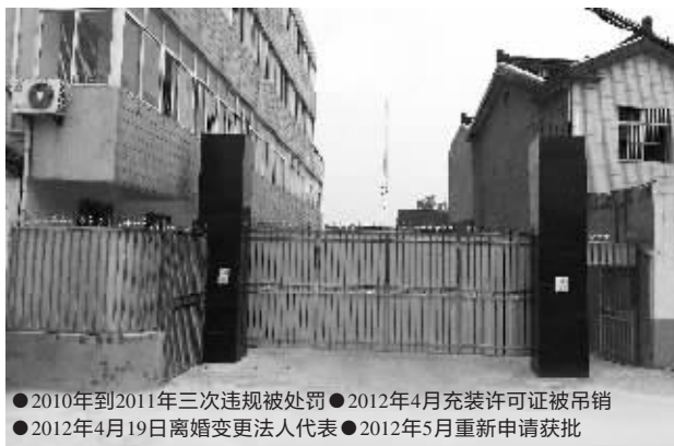
●2010年到2011年三次违规被处罚 ●2012年4月充装许可证被吊销 ●2012年4月19日离婚变更法人代表 ●2012年5月重新申请获批

“离婚后想自己点事情,就向质监部门申请了充装许可证。质监部门给我发证,是合理的。”陈某表示,公司已经停业好几个月,目前正在建设部门办理相关手续,具体什么时候能营业还不确定。