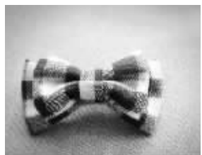
格子布蝴蝶结发夹很可爱