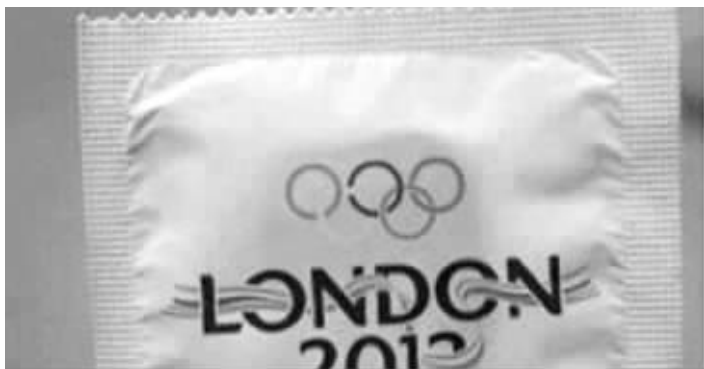
15万只避孕套也不够,伦敦市长都坐不住了