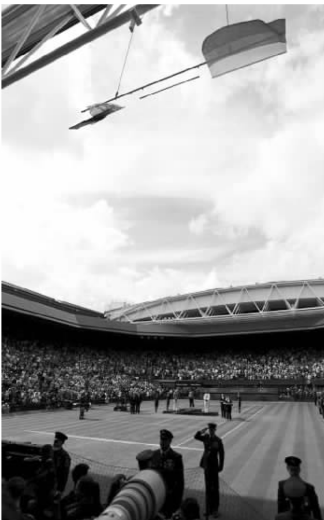
“风”狂,美国国旗被吹走了