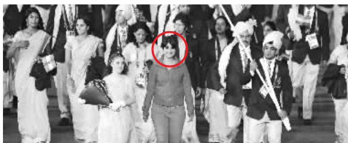
这个神秘女子出尽风头