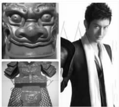
黄晓明捐出《鹿鼎记》的道具盔甲