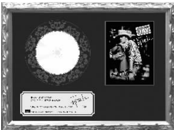
周杰伦捐出的“青花瓷”demo碟片