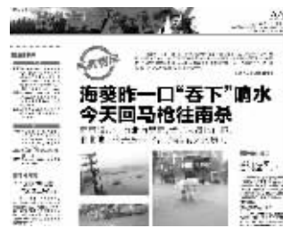
“海葵”带来暴雨,响水遭袭 快报8月11日相关报道