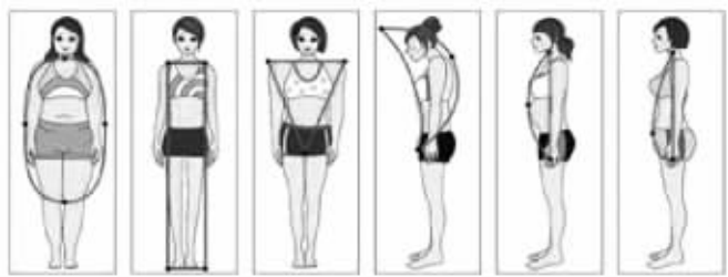
1.圆滚滚型 2.纸片人型 3.金刚芭比型 4.老太婆型 5.啤酒桶型 6.肥青蛙型