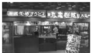
超受欢迎的纯正日式乌冬面

自今年1月开业以来,乐购仕生活广场以其特色齐全的商品、人性化的服务理念受到南京市民的青睐。作为新型家居、电器、美食、生活ShoppingMall,2万余平方米的超大购物空间,产品品类极大丰富,只要与居家生活相关,大到几十万元的智能化家电系统,小到几十元的数码配件产品,20余种丰富的商品,完全满足顾客的选购需求,确保消费者吃喝玩乐购一站齐全。