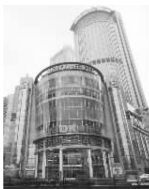
山西路1号的乐购仕生活广场

自今年1月开业以来,乐购仕生活广场以其特色齐全的商品、人性化的服务理念受到南京市民的青睐。作为新型家居、电器、美食、生活ShoppingMall,2万余平方米的超大购物空间,产品品类极大丰富,只要与居家生活相关,大到几十万元的智能化家电系统,小到几十元的数码配件产品,20余种丰富的商品,完全满足顾客的选购需求,确保消费者吃喝玩乐购一站齐全。