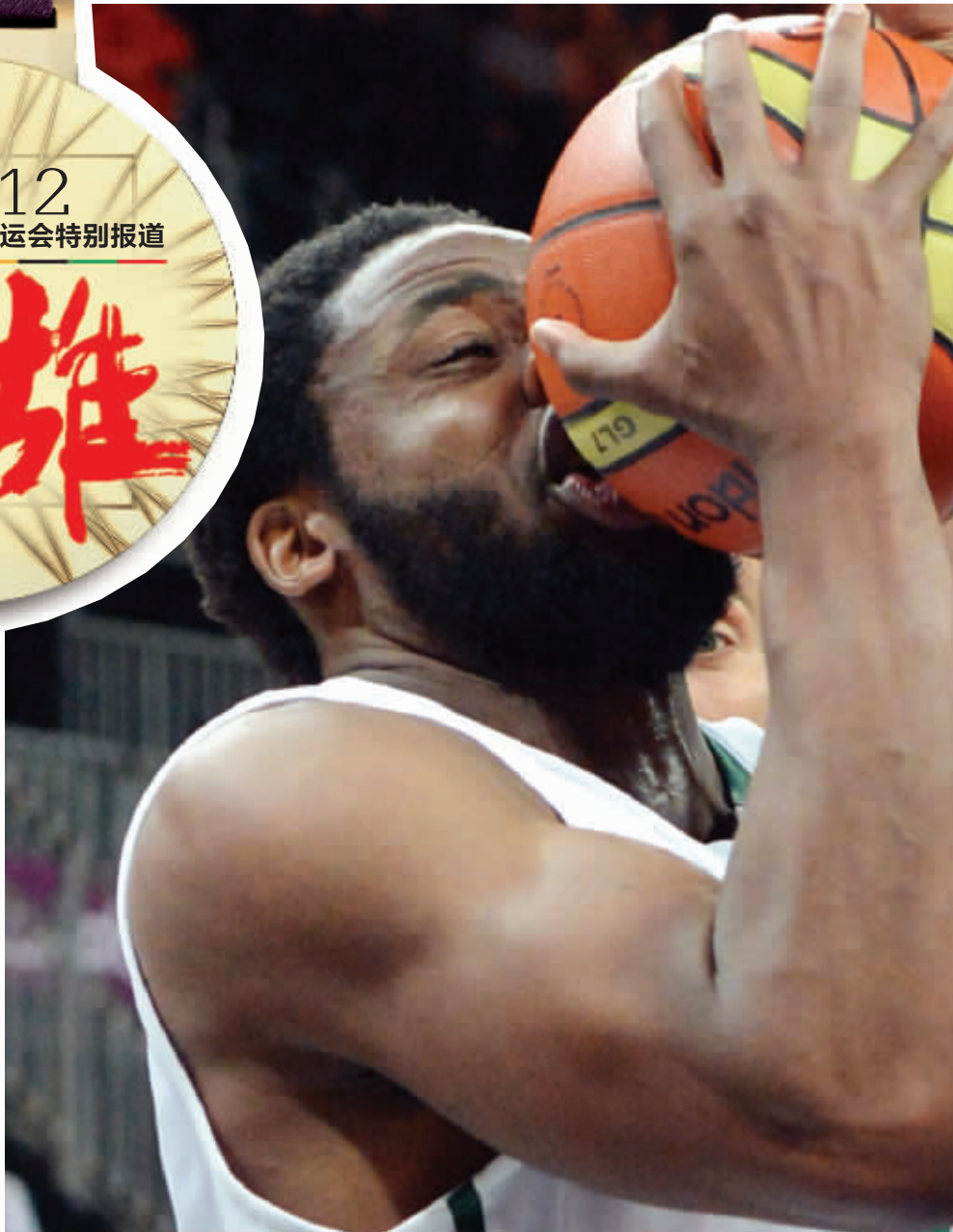
1.我真的吃不下这个篮球

现代快报 A32 精彩一刻 2012年8月10日 星期五 责任编辑:潘文军 美编:于飞 组版:杨建梅