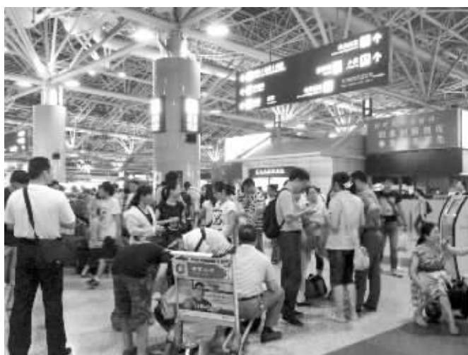
数千旅客昨晚滞留机场