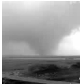
网友拍到的“龙卷风”画面