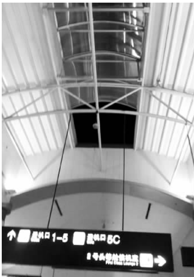
禄口机场候机大厅顶棚破了一个洞