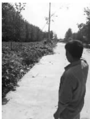
路两边,原来是划的宅基地