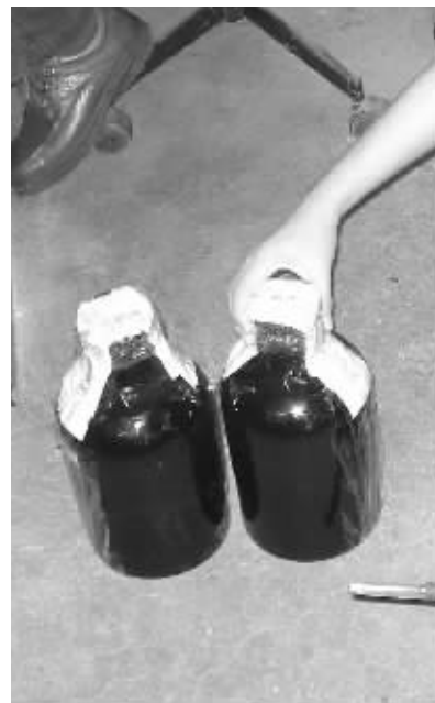
工作人员给取样的汽油贴上封条