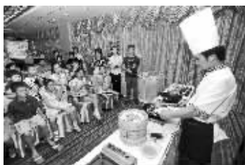
学做营养餐

快报讯(实习生 罗睿 记者 安莹)昨天,兴隆街道奥体社区举办了“迎青奥,健康饮食从娃娃抓起”的活动。现场,酒店的大厨手把手地教小学生们做一些简单的运动营养餐。